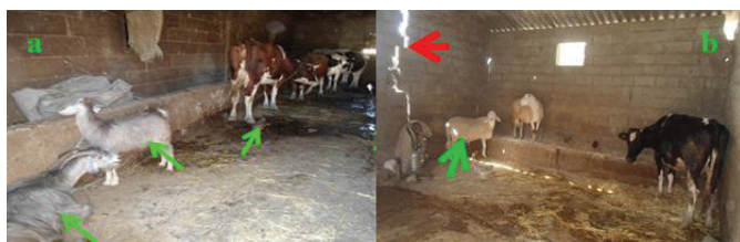
Figure 4. Promiscuité des bovins avec les caprins et les poulets d'élevage traditionnel (a) et les ovins (b). La flèche rouge indique la fissure sur le mur du bâtiment.

sensibles aux pathologies intra spécifiques. D'ailleurs, l'eau de boisson distribuée aux animaux est de qualité médiocre en raison de la présence de déjections et de concentré alimentaire qui favorise la pullulation de bactéries et des parasites pathogènes. Dans les élevages laitiers, l'eau d'abreuvement doit être potable et de bonne qualité microbiologique (Meyer et Denis, 1999).