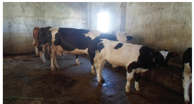
Figure 3. Élevage montrant l'absence de litière

L'existence d'une litière réduit de 50 % les mammites qui sont fortement liées à la propreté de l'aire de couchage (Haj Mbarek et al., 2014). Or dans notre enquête, les mauvaises conditions hygiéniques précitées associées à l'absence d'une litière (Figure 3) sont autant de facteurs prédisposant aux mammites. De plus, selon Doublet et al., (2012), l'antibiothérapie mammaire répétée sans contrôle vétérinaire préalable, plaide en faveur de la forte proportion d'antibiorésistance rencontrée dans cette étude.