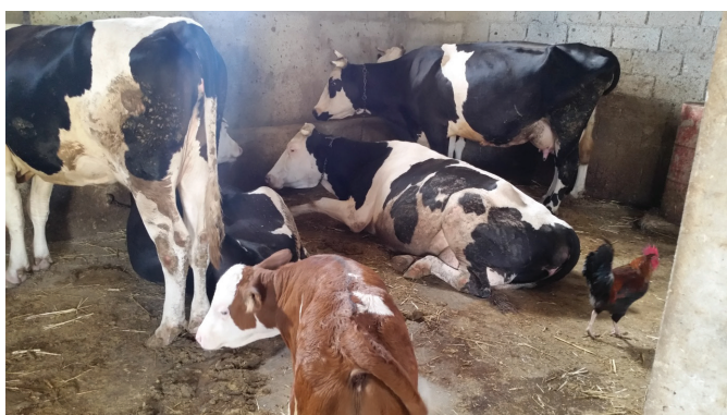
Figure 5. Promiscuité des bovins avec les poulets d'élevage traditionnel

Le suivi d'une formation en élevage permet une maîtrise des facteurs zootechniques et sanitaires afin de rentabiliser un élevage laitier (FAO, 2015). Dans notre enquête, 94 % des propriétaires avaient un niveau de base (primaire, collège et secondaire). Parmi eux 17% déclarent avoir suivi une formation en élevage au centre de formation des services de la direction agricole de la Wilaya de Constantine. Des résultats médiocres ont été obtenus chez cette catégorie d'éleveurs. Cette situation est similaire à celle observée à Tizi Ouzou (Kadi et al. , 2007) et à Chellif (Belhadia et al. , 2009). Dans cette catégorie, la main d'œuvre disponible sur l'exploitation est temporaire, occasionnelle et gratuite (parents, enfants, ...), similaire aux résultats rapportés par Belhadia et al. , (2009) à Chellif.