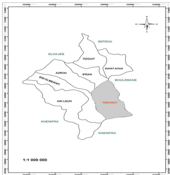
Figure 1: Localisation de la commune rurale de Timahdit (Laaroussi, 2001)

La commune rurale de Timahdit est située dans la région de Fès-Meknès au cœur du Moyen Atlas, avec une altitude qui varie entre 1800 et 2100 m et s'étend sur une superficie de 617 km 2 (Figure 1).