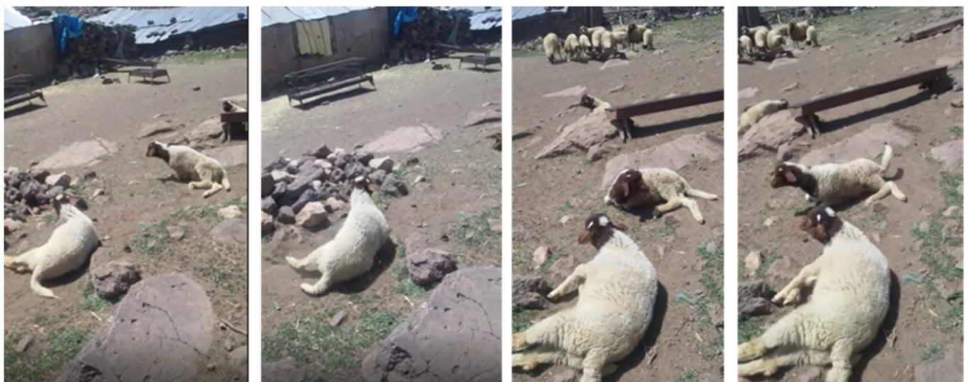
Figure 4: Agneaux atteints de parésie du train postérieur, éprouvant des difficultés ou une impossibilité à se relever